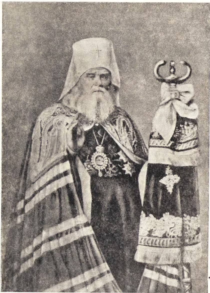
Митрополит Московский Иннокентий

четыре года, и только в 1821 году он был рукоположен во священника на открывшуюся вакансию в той же Благовещенской церкви.